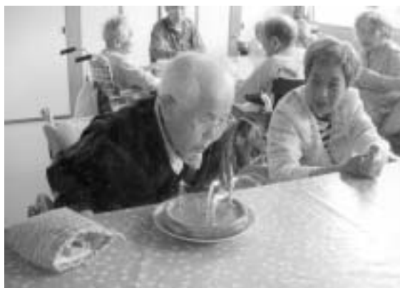
ハッピーバースデー トウ ユー 今日は私の誕生日。 手作りのケーキありがとう!!