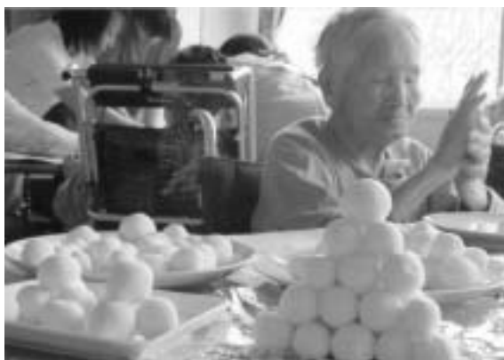
星ユニットではお盆のだんご作り まるめて… まるめて…