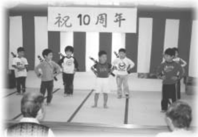
内外海保育園児さん かっこいい踊りありがとう