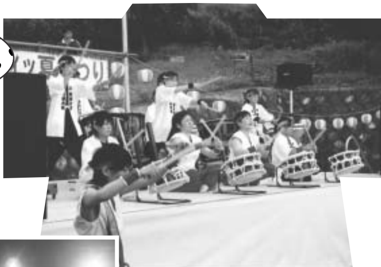
大飯ブレイズの皆さんの 迫力あふれる太鼓です