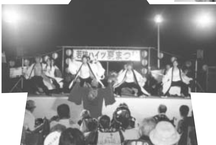
福井から出演して下さいました サムライシューティングスターの 力強いヨサコイソーランです