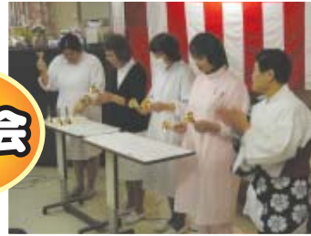
ハンドベル リンリン