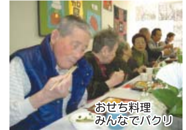
おせち料理 みんなでバクリ