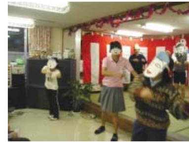
アララの じゅもん