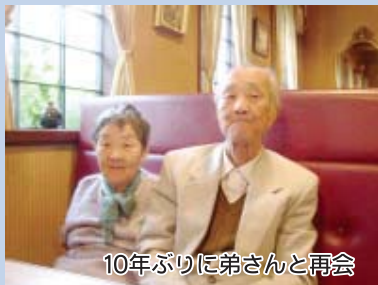
10年ぶりに弟さんと再会

18年11月27日～28日の両日、四国（松山市）へ職員と共に自動車で弟さんに会いに行きました。往復900kmという長道中でしたが、疲れもみせず10年ぶりの松山に大変喜ばれ、弟さんとも話がはずんでいました。