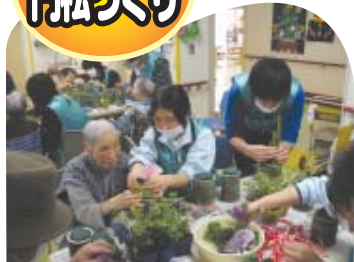
小浜市ユースチャレンジャー隊の皆さんありがとうございました