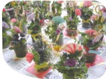
たくさんできました