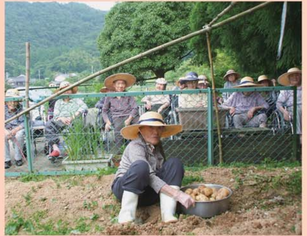
みんな見とるかア？ ぎょうさんとれたで～