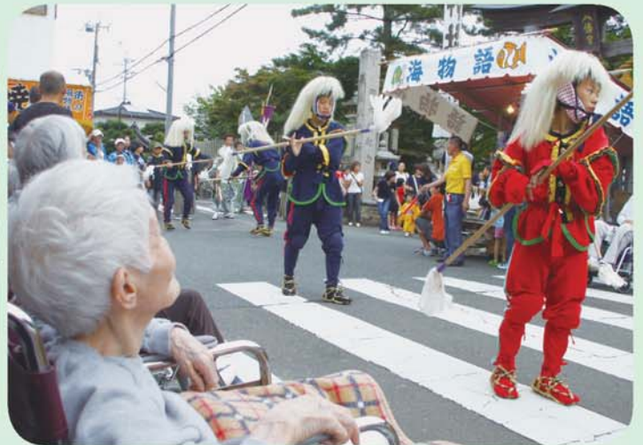
棒振り にぎやかで楽しそうやなあ～