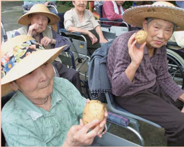
こんなに大きなじゃが芋が採れました ワーイ！