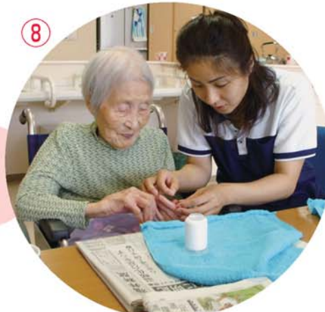
タオル作り ……糸通りますか？