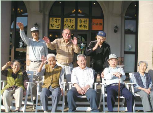
高浜 道の駅 ジェノバに行ってきました