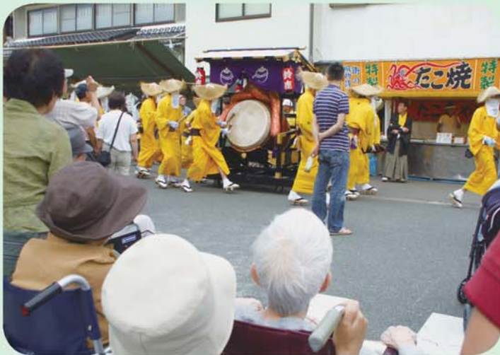
やっぱり太鼓はいいなあ～