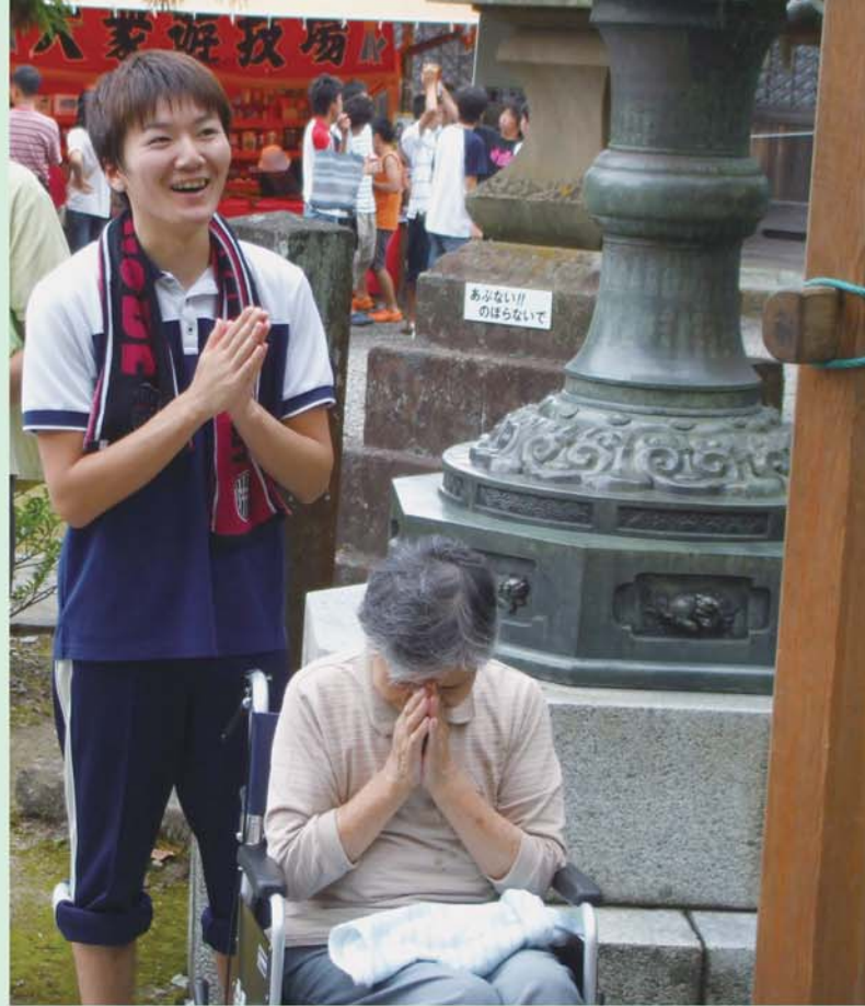
家族みんなが幸福でありますように♡