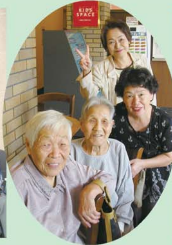
ボランティアの、こすもすケアの皆様も一緒に来てくれました