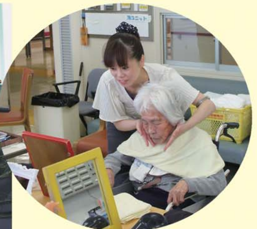
あれ、恥ずかしいわでも、気持ちがいいわ