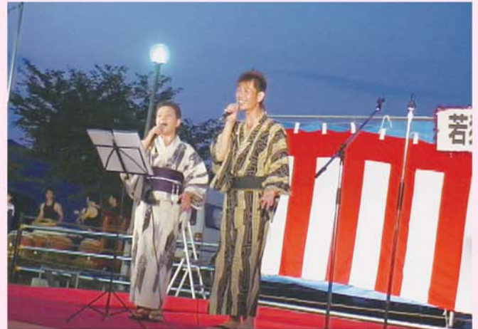
内外海のみなさん、しばらくでございます 再びお招きいただき、ありがとうございます さあ、みなさんも一緒に歌いましょう