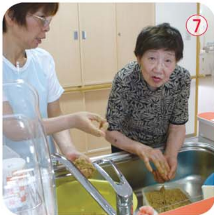
昔とった杵柄！ めか漬け 「お昼に食べましょうね」