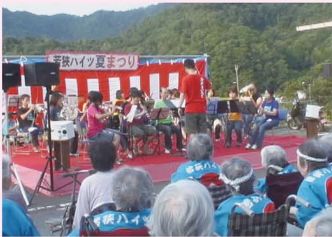
今日のために練習してきました ウインド アンサンブルです グループ丸となって 演奏します みんな聞いて下さい。