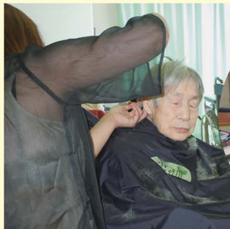
上手に切ってねえ ちんちくりんは嫌よ～