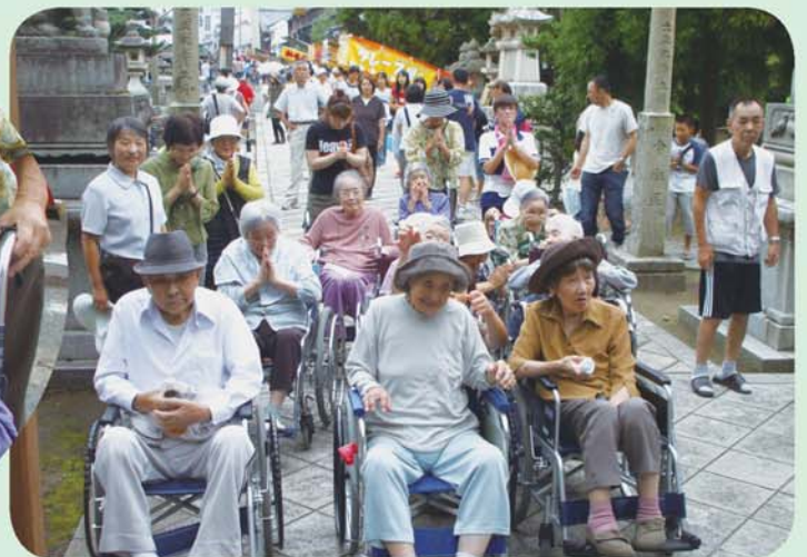
八幡さんも久しぶりに来たのう やっぱり立派な神社やなあ