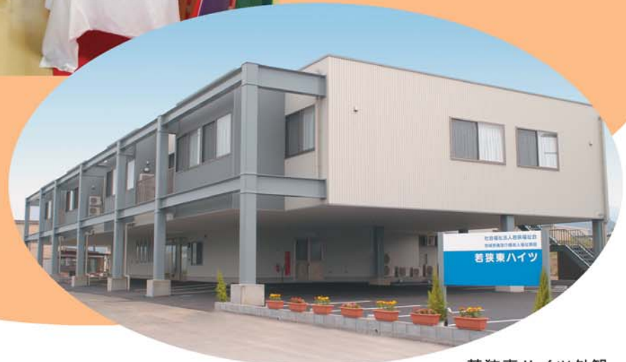
若狭東 Heights 外観