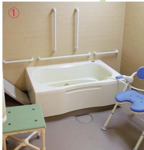
個浴 / 同脱衣所

そのために、入居者さんがこれまでの人生で培った価値観や人生観、人間関係を大切にし、一人ひとりの「想い」にスポットをあてた、その人の人生に寄り添う介護、「その人らしい暮らし」ができるような、きめ細やかな介護を目指しています。