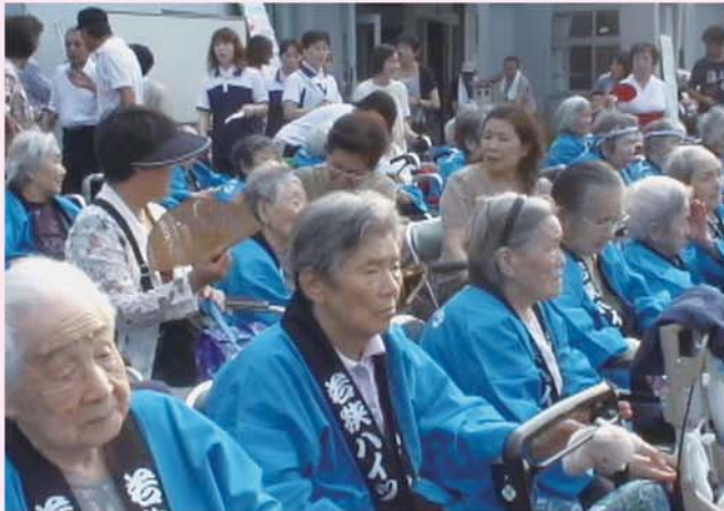
今年の夏まつりも楽しいなあ～ これから何が始まるんやろ～?