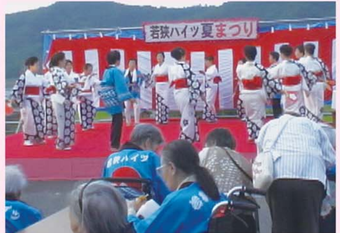
栄扇会の皆さま 浴衣姿が涼しげで、踊る姿はユリの花 今年もありがとうございました