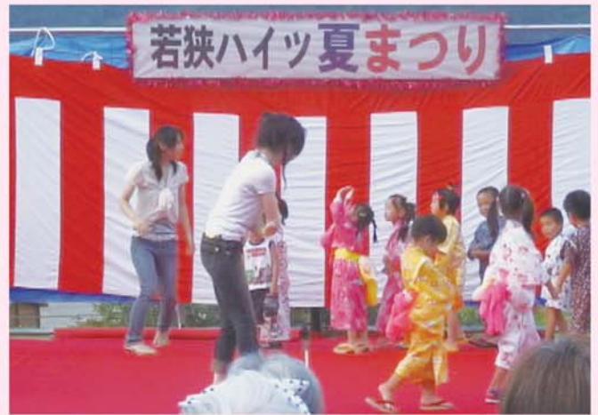
内外海保育園児のおゆうぎ あれー、かえらしいなァ (かわいらしい) うちの孫、おるかナァ!