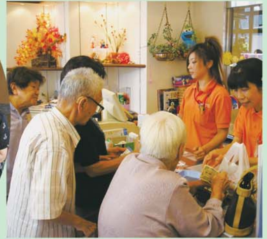
源六餅 買おうかな～