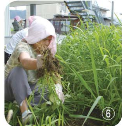
草むしりも手伝ってもらいました (暑い中、すみません)