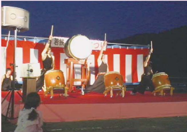
内外海じゅうにひびきわたった勇粋連太鼓 迫りに圧倒された～ 私にもできるかな～

今年の夏まつりは、舞台を設置して多彩な出し物を観ていただくことができました。出演していただいた方々には、紙面をお借りしましてあらためてお礼申し上げます。暑い中の開催となりましたが、これからも利用者の方、ご家族の方々に楽しんでいただける夏まつりを目指して、企画していきたいと考えています。皆様のご協力をよろしくお願い致します。