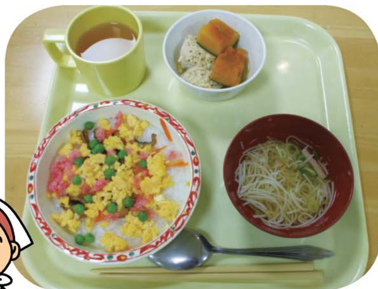
ひなまつりの夕食 ちらし寿司