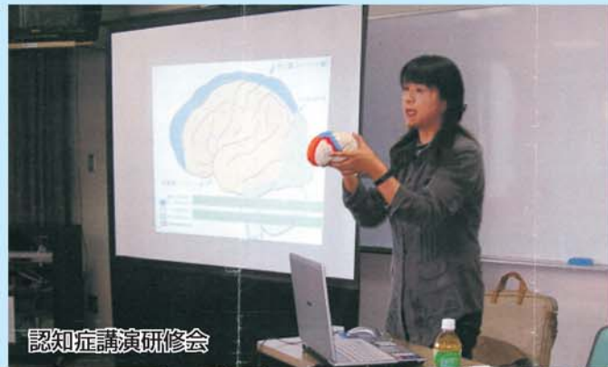
認知症講演研修会

また、内部研修会も毎月実施し、各部署の職員が担当を持ち、各専門分野での知識を学び取る機会を設けています。