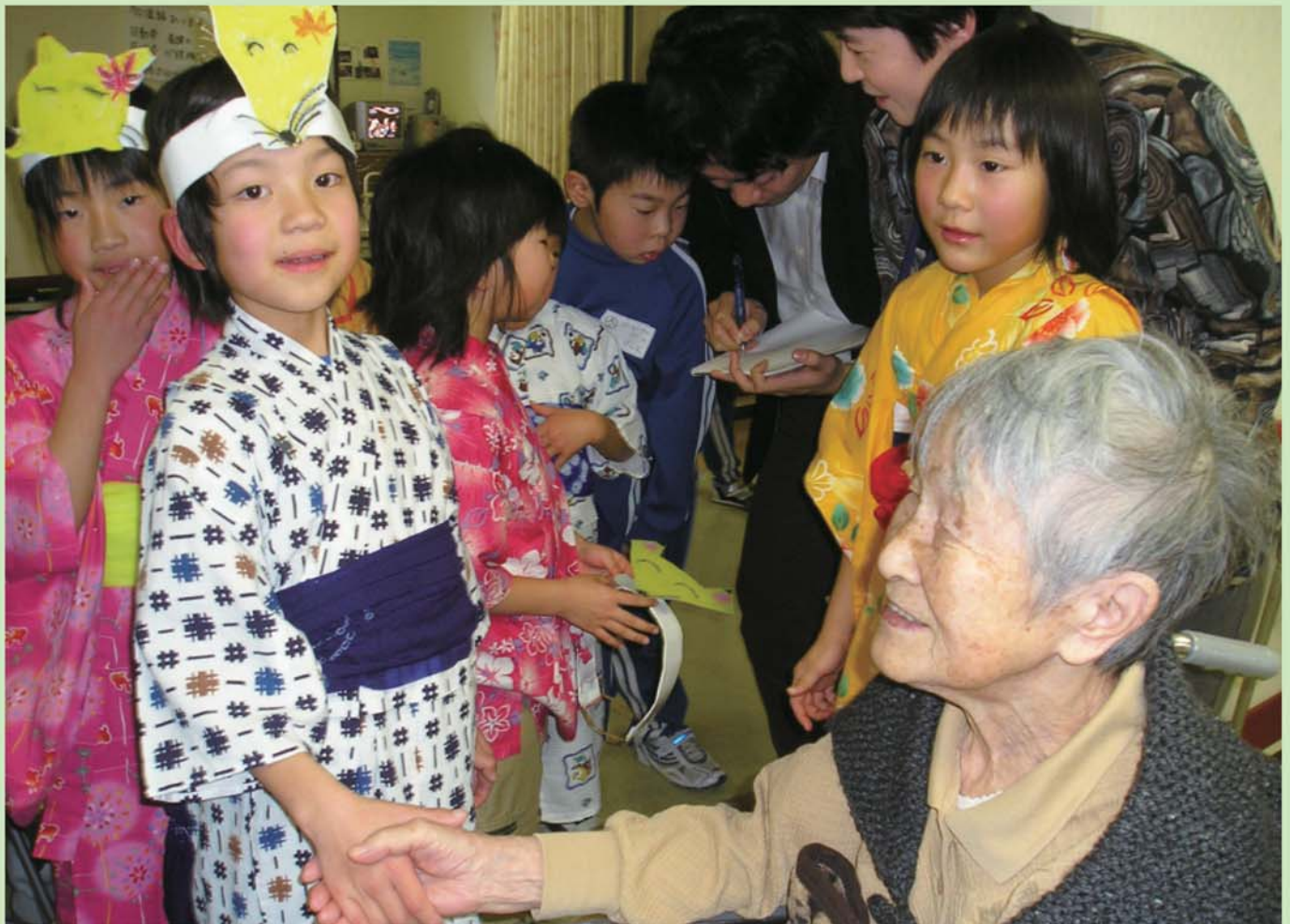
内外海小学校児童との交流会

平成20年3月発行 社会福祉法人 若狭福祉会 〒917-0106 福井県小浜市阿納尻第59号9番地の1 TEL. 0770-53-2940 FAX. 0770-53-2965