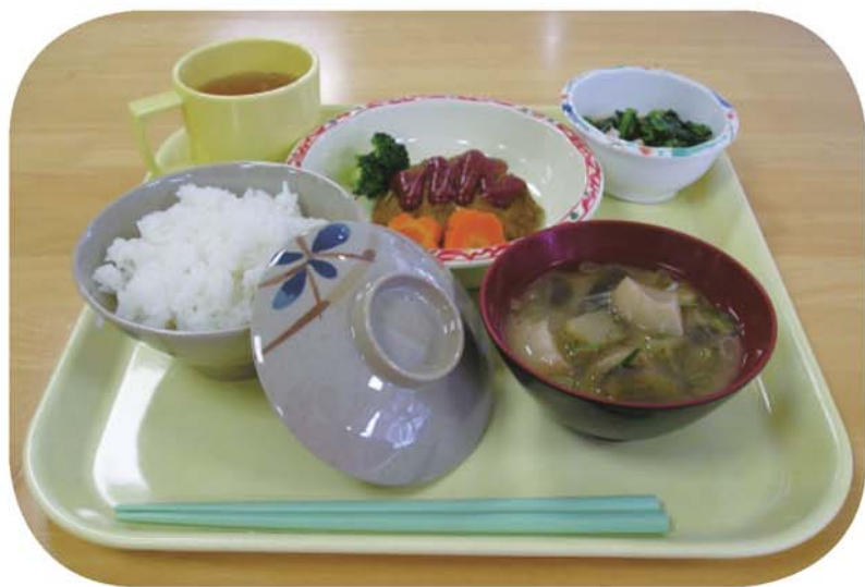
食器が新しくなって 見た目も味もタイコパン

日常生活を通じ欠かせないのが食事!! 栄養を摂取するのめたいへん大事なことです。