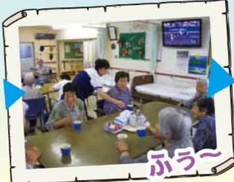
お茶を飲んで一休み