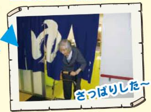
9:30～ 入浴! ♨️