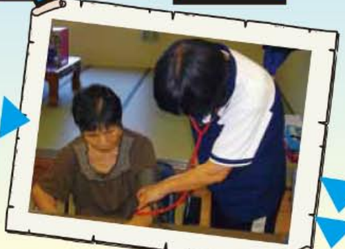
看護師による健康チェック 血圧どうかなあ?