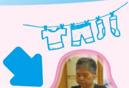
洗濯物たたみ 毎日やっています!!