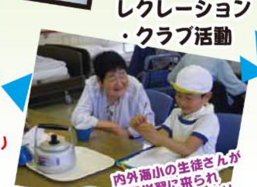
内外通小の生徒さんが 体験学習に来られ 一緒にケニムしたり 質問を受けたりしました。