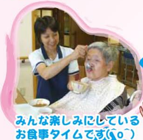
みんな楽しみにしている お食事タイムです(0^)