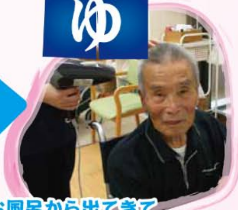
お風呂から出てきて サッパリきれいになりましたあ