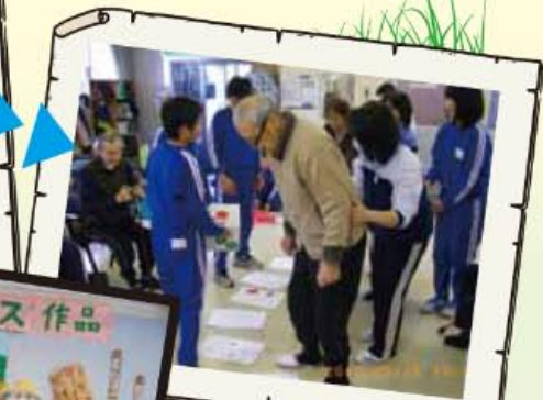
15:00～ レクリエーション ・クラブ活動