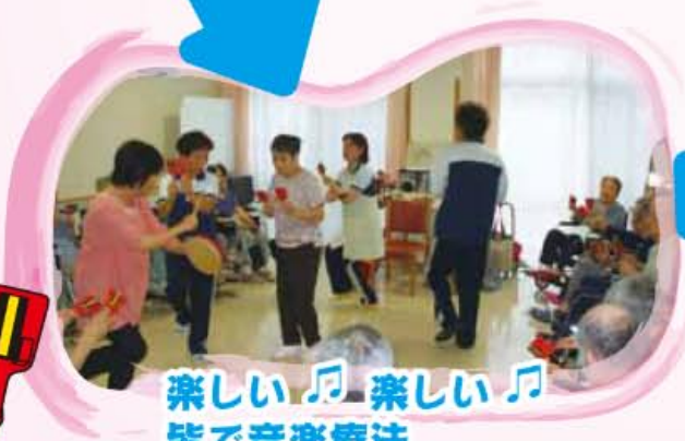
楽しい♪ 楽しい♪ 皆で音楽療法