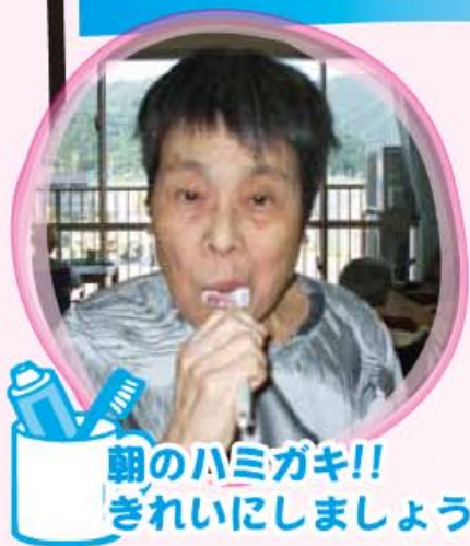
朝のハミガキ!! きれいにしましょうね。