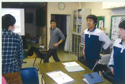
腰痛予防体操を教えてくださいました。