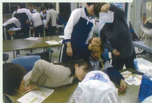
ユニチャームのおむつの吸収チェック(流れ)