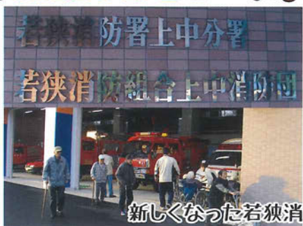
新しくなった若狭消防署上中分署を見学。中の充実した設備にビックリ！！