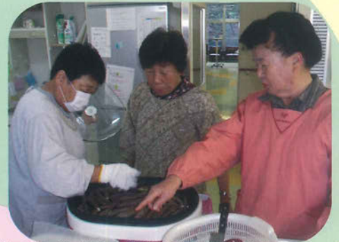
細いイモは大学イモに変身! 火おこしに調理にお手伝い頂きました。