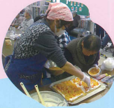
フルーツたくさんのせましょ♡