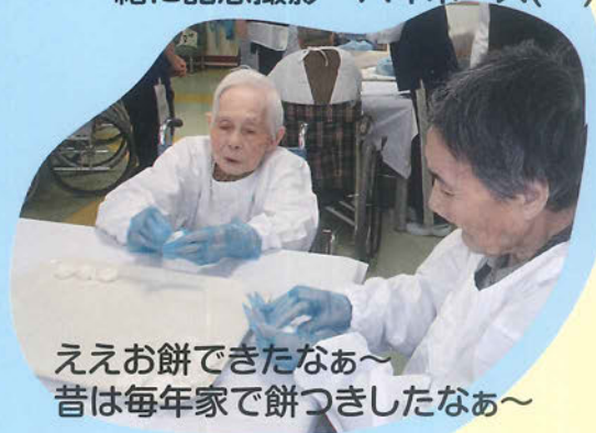
ええお餅できたなあ～ 昔は毎年家で餅つきしたなあ～