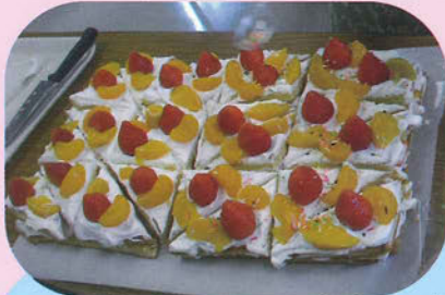
ジャン!!美味しそうに出来上がり!