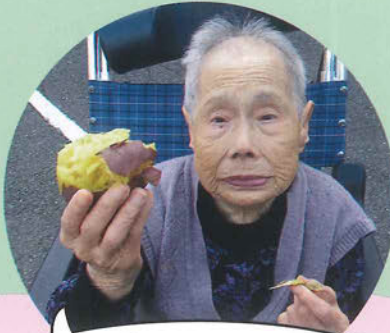
甲ヶ崎のサツマイモは サイコーや!!