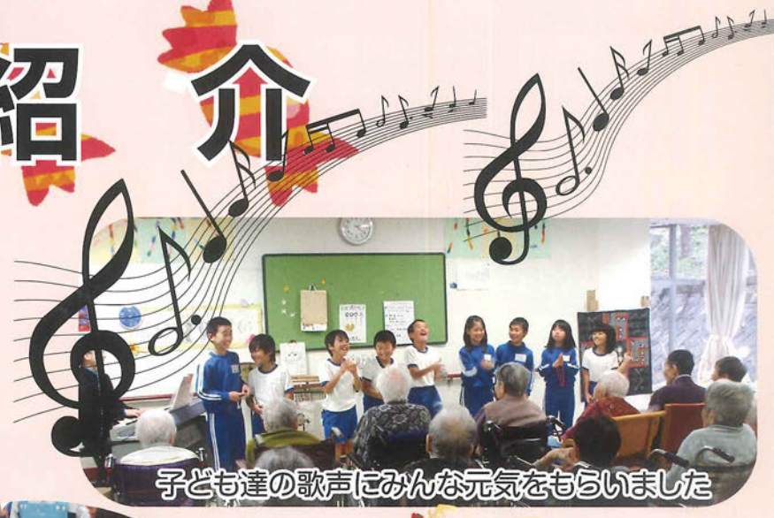
子ども達の歌声にみんな元気をもらいました