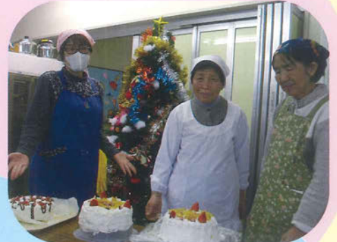
出来上がったケーキと 一緒に記念撮影 ハイポーズ(^^)