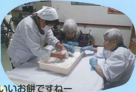
いいお餅ですねー 大きさはどのくらいにします?