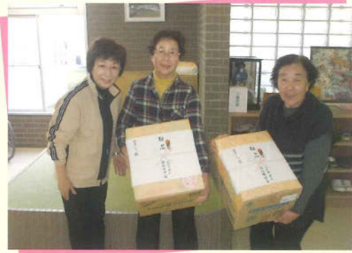
・タオルや日用品