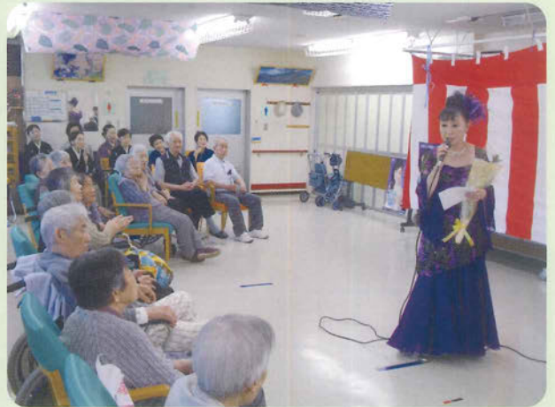
歌手 高田ひとみさんコンサート