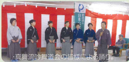
真舞流吟舞道会の皆様による踊り。