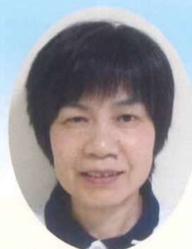
小城 夏江 東ハイツ 介護職員