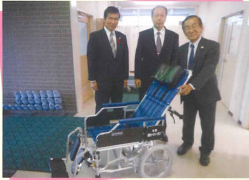
・リクライニング式車イス3台