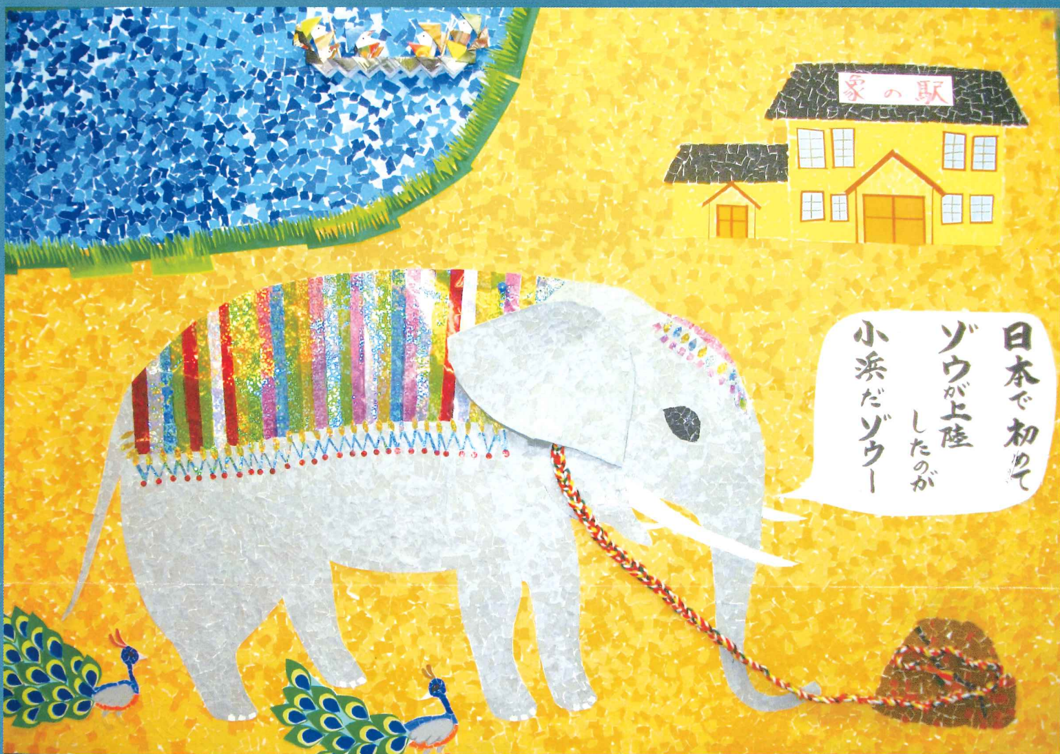
シルバーフェアに出展した絵画(デイサービス)