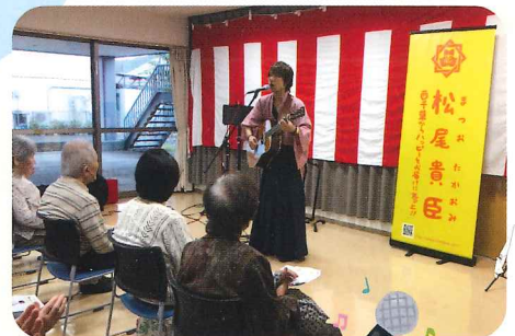
ホスピタルライブ 東ハイツに「坂本龍馬」がやって来ました♪