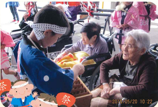
すずしろ子どもみこし みんなでワッショイ!!