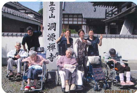
4月はサクラ、5月はツツジとお花見を楽しみました。