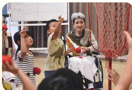
遠敷保育園の園児さんと一緒にミニ運動会 玉入れにパン食いと笑顔の1日でした。