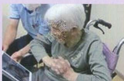
LINEを使ったオンライン面会