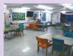
飛沫防止パーティション（1F食堂・2F食堂・デイホール）（東食堂）