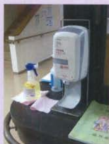
自動噴射式消毒液スタンド