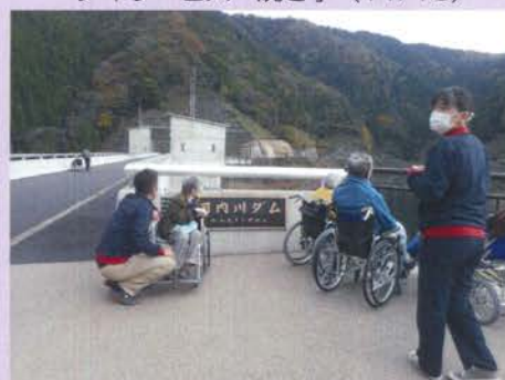
紅葉狩りドライブ (11/4)