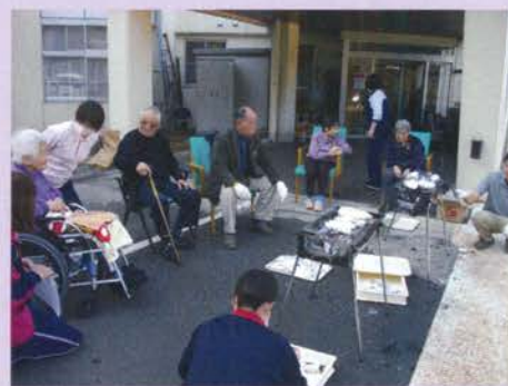
デイサービス 焼き芋 (11/18)